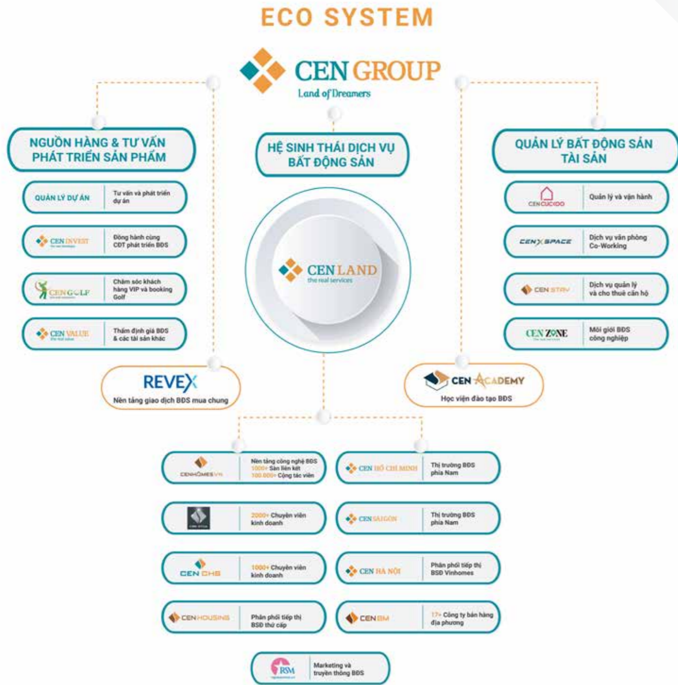
Hệ sinh thái Cen Land