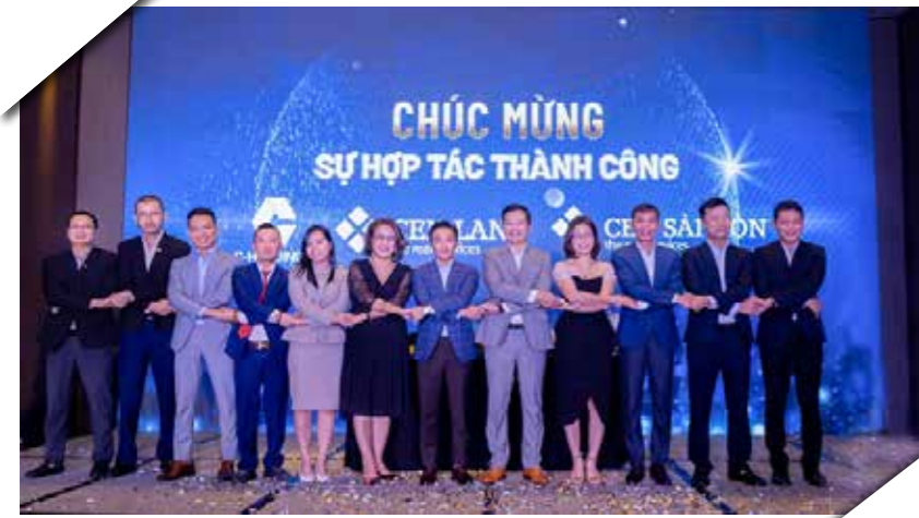
CRE hợp tác với C-Holdings.

Theo đó, tổng giá trị đầu tư khoảng trên 485 tỷ đồng.