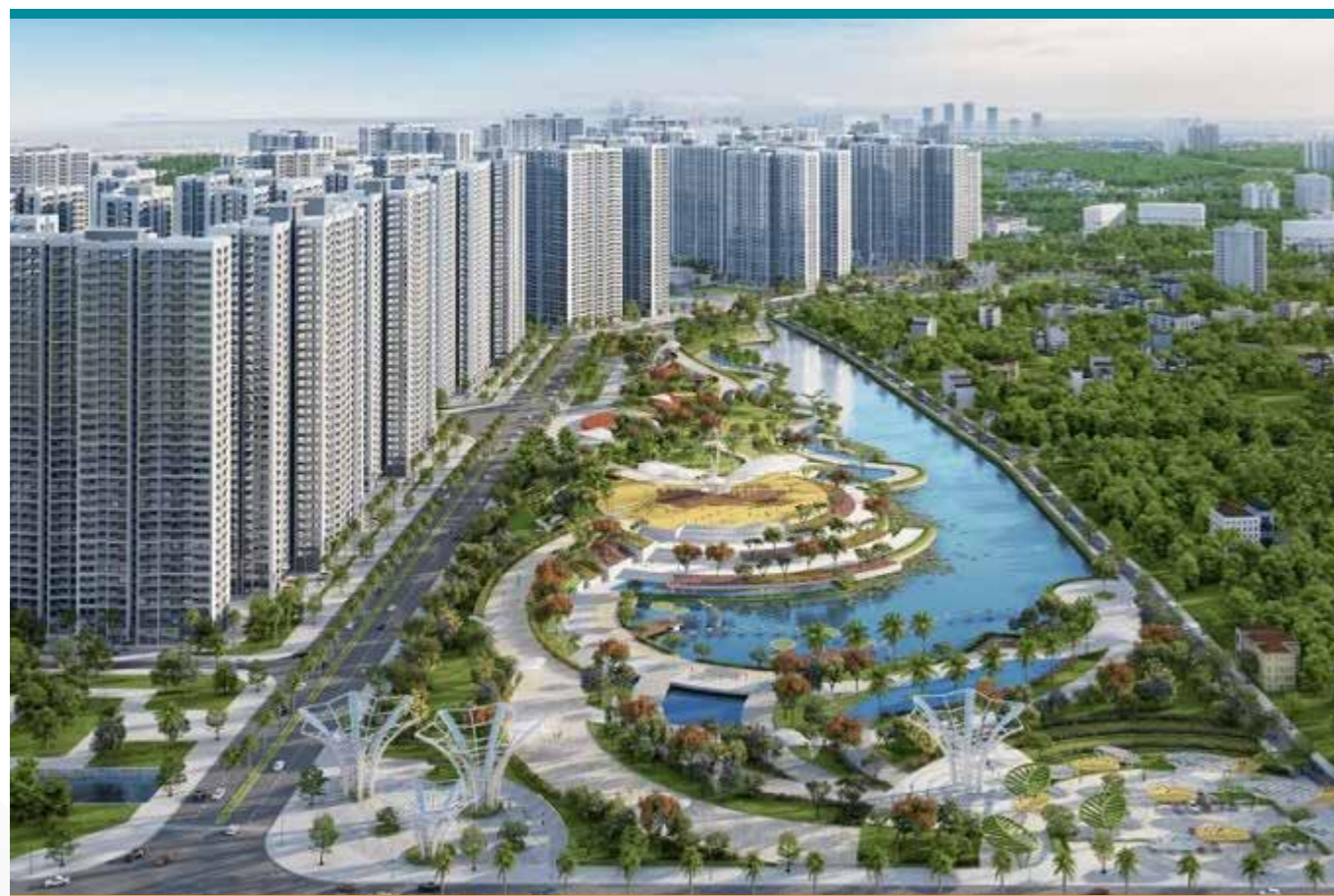
Chọn mặt gửi vàng từ Vinhomes, Cen Hà Nội đã lập tức ghi điểm với nhiều giao dịch thành công tại dự án Vinhomes Smart City.

Cách đây 5 năm, Cen Land đã thành công trong phân phối các dự án của Vinhomes. Doanh thu từ các phân phối các sản phẩm của Vinhomes mang lại nguồn tài chính lớn cho Cen Land. Đồng thời, Cen Land đã có thêm kinh nghiệm khi làm việc với các chủ đầu tư lớn, phân phối bán hàng chuyên nghiệp. Từ kết quả đó, Cen Land đã nâng tầm vị thế, đứng đầu trong phân phối bất động sản, mở thêm cơ hội bắt tay với các chủ đầu tư khác trên thị trường.