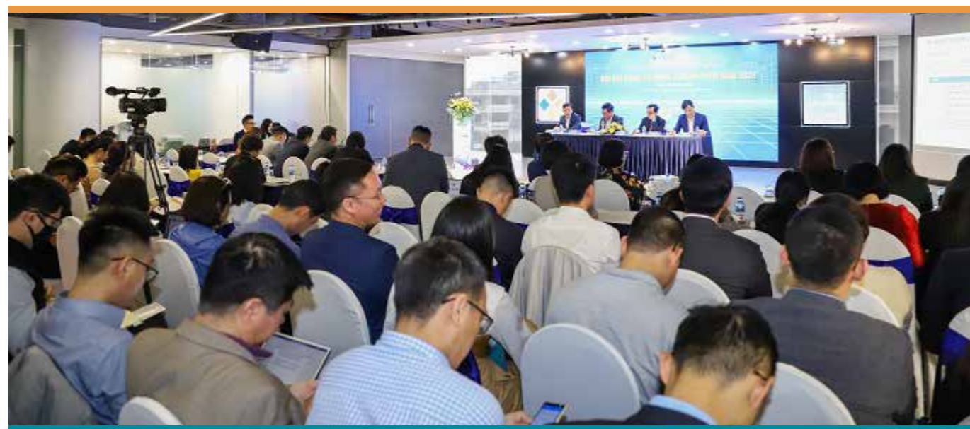
Đầu tháng 4, Cen Land bất ngờ công bố thay đổi kế hoạch doanh thu 2021 lên 5000 tỷ đồng ngay trong ĐHĐCĐ

Lợi nhuận sau thuế của đơn vị này cũng tăng kỷ lục, lợi nhuận sau thuế hợp nhất quý I/2021 là 122,6 tỷ đồng, hoàn thành 30,1% kế hoạch của năm. So với cùng kỳ năm ngoái, doanh thu thuần của Cen Land tăng 656,7%, lợi nhuận sau thuế tăng 190,2%.