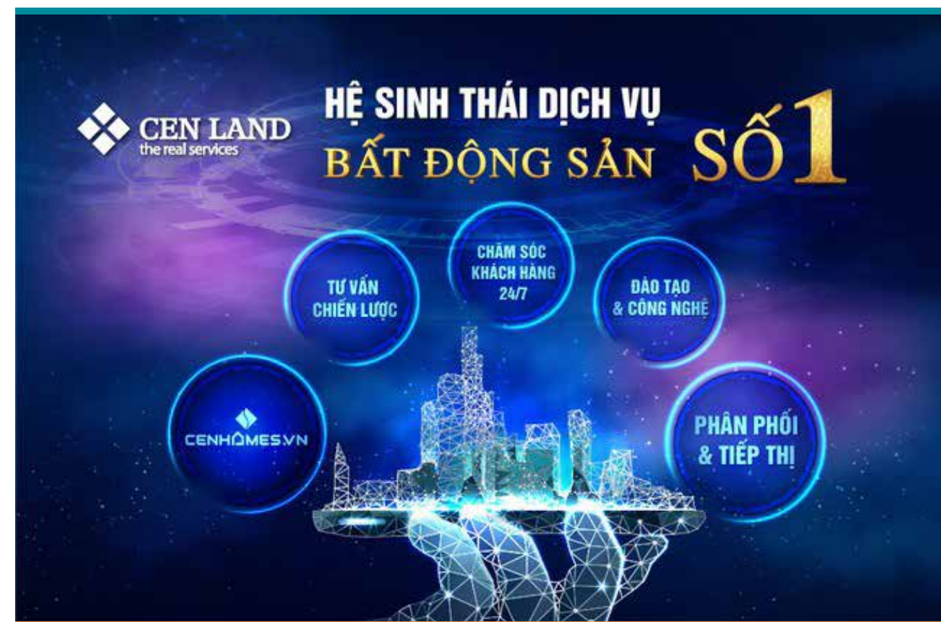
Cen Land đang ngày càng hoàn thiện hệ sinh thái dịch vụ bất động sản số 1

Với chiến lược mở rộng hợp tác với một loạt các chủ đầu tư có số lượng hàng lớn như: Vinhomes, Nova-land, Bitexco... Cen Land đã xây dựng những đội quân đặc nhiệm cho từng chủ đầu tư, mở rộng mạng lưới các công ty bán hàng địa phương trên toàn quốc, đa dạng hóa các kênh bán hàng để phân phối các sản phẩm bất động sản khác nhau ra thị trường.