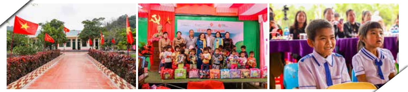
Niềm vui ánh lên trong mắt các em nhỏ điểm trường Cà Xen khi được học tập trong ngôi trường mới.