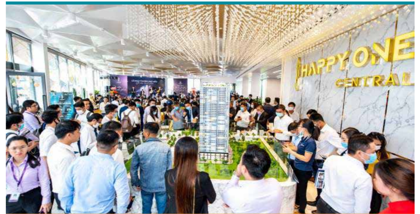
Cen Sài Gòn phát triển kinh doanh giai đoạn 1 dự án HAPPY ONE – Central thành công với hơn 90% giỏ hàng tìm được chủ nhân.